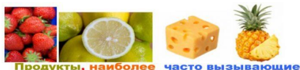
Продукты, наиболее часто вызывающие

Оградите ваш дом от факторов риска. Держите домашних животных на участке или отдайте их в хорошие руки. Не курите в доме. Не пользуйтесь благовониями и другим сильнопахнущими веществами. Уберите пледы и ковры, мягкие кресла, лишние подушки и все, где может собираться пыль. Наденьте специальные пыленепроницаемые чехлы на подушки и матрасы. Пользуйтесь гипоаллергенными матрасами, подушками и одеялами. Стирайте постельное белье и